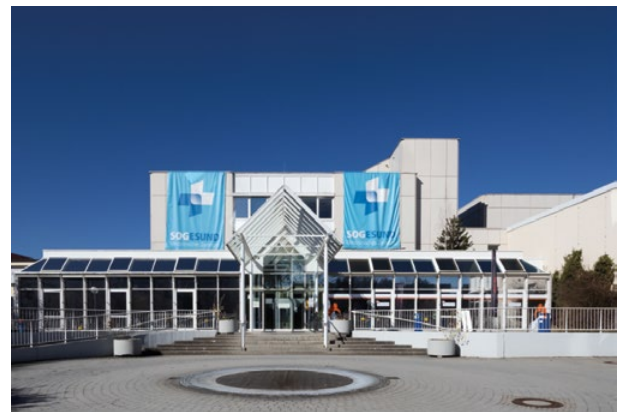
(Schongau: Kompetent. Persönlich. Vielfältig. Das Medizinische Zentrum SOGESUND hat zahlreiche ambulante und stationäre Angebote)

den ambulante Patienten mit Physiotherapie und Physikalischer Therapie versorgt. Und im Ambulanten OP-Zentrum operieren erfahrene Fachärzte der Region Weilheim-Schongau mit den Ärzten der Krankenhaus GmbH Hand in Hand.