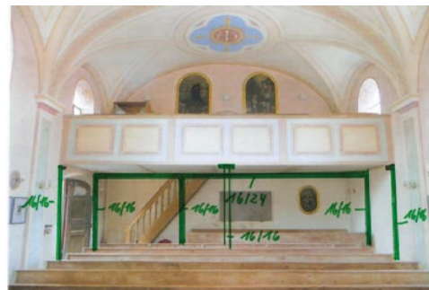
Geplante Sicherung der Empore

eine Sicherung der Empore sowie statische Sicherungsarbeiten am Gewölbe (Langhaus und Chor, Turmhelm und Empore). Die geplanten Gesamtkosten der Maßnahme sind noch nicht genau zu beziffern, dürften jedoch im Bereich von ca. 50.000 € bis 60.000 € liegen. Um die Arbeiten kosteneffektiv gleichzeitig mit der Renovierung der Pfarrkirche „St. Remigius“ durchführen zu können, wurde nun in einem ersten Schritt ein Statiker mit der Planung beauftragt. Der für die Pfarrkirche zuständige Architekt wird dann auch für St. Margareta die Bauleitung übernehmen. Auch dieses Projekt wird nur zum Teil von der Diözese gefördert, weshalb wir wiederum auf Unterstützungen angewiesen sind.