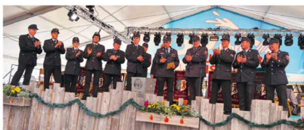
Der Festausschuss unserer Feuerwehr Raisting bedankt sich im Festzelt offiziell bei allen anwesenden Feuerwehren, Vereinen und Gästen.

Ein besonderer Dank gilt allen Helferinnen und Helfern sowie den Ehrenamtlichen, die sich bereits seit über einem Jahr mit der Vorbereitung, Planung und Festschrift beschäftigt haben. Ohne unsere Hauptsponsoren, Spender und Anzeigenkunden wäre diese Festwoche nicht möglich gewesen. Die Feuerwehr Raisting bedankt sich herzlich für eine rundum gelungene Festwoche. ■